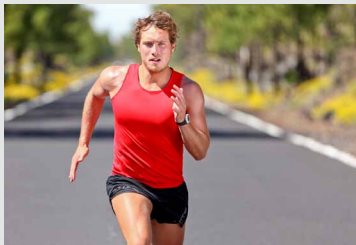
Ich brauche die Herausforderung, Entspannung und den Ausgleich

Akupunkt- und Fussreflexzonen-Massage sowie die Lymphdrainage tragen dazu bei die Lebensqualität zu verbessern. Sie fühlen sich nicht nur besser und ausgeglichener sondern innerlich gestärkt, im Lot und mit geschärftem Fokus. Sie werden sich neuen Herausforderungen gelassener, selbstsicherer und mit neuer Zuversicht stellen.