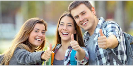
Fit im Studium / im Beruf