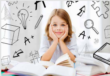
Wie schaff' ich das?