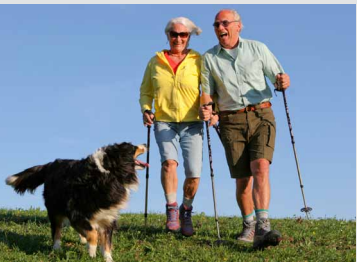
Vernügt im Alter